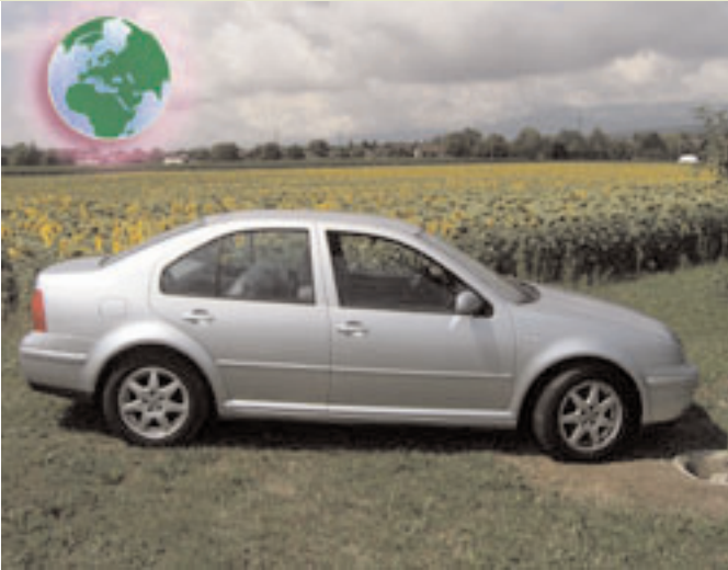
Notre VW Bora 2000 qui roule à 100% avec de l'huile végétale grâce au kit bi-carburant

Le kit ATG est disponible sur devis auprès de l'entreprise Fenec 4x4 à Genève et son prix se situe à partir de 520 Euros hors taxes et hors frais de port.